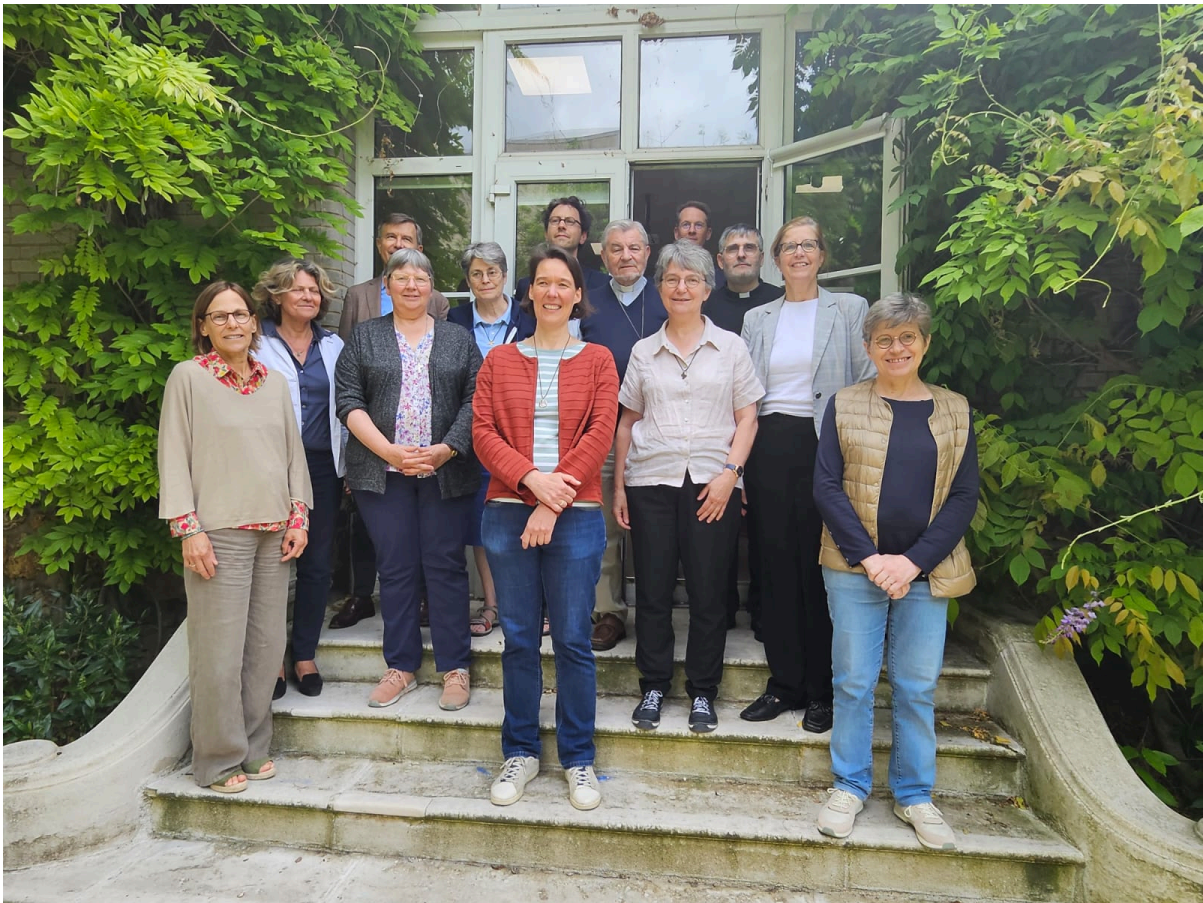
Conseil d'Administration de CORREF & CIE - 9 juin 2026