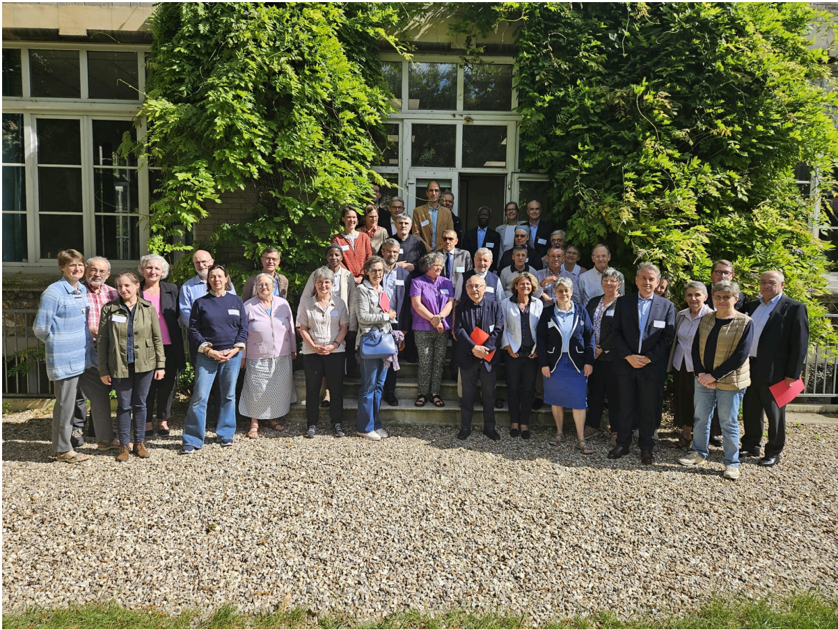
Assemblée Générale de CORREF & CIE - 9 juin 2026